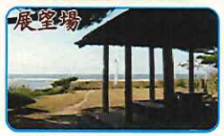
雄物川の河口と日本海が一望できる四門があります。ここから眺める夕陽は最高!

古代の大地震で勝平山が崩れた際に、勝平寺から消えた石仏の一つではないかとも、伝えられています。