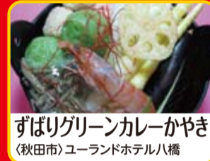
ずばりグリーンカレーかやき (秋田市)ユーランドホテル八橋