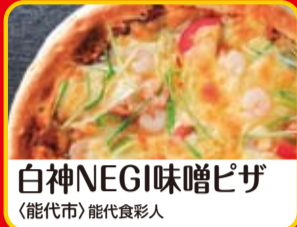
白神NEGI味噌ピザ (能代市)能代食彩人