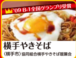
横手やきそば (横手市)協同組合横手やきそば暖簾会

ご当地B級グルメをはじめ、秋田のうまいもんが大集合!秋田のうまいもんを食べ尽くそう!