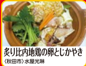
炙り比内地鶏の卵とじかやき (秋田市)水屋光琳

秋田かやき四天王'11 漁師が鍋の代わりに貝を使って料理。貝焼きが訛った言葉が「かやき」。郷土の歴史と共に育まれてきたこの「秋田かやき」をさらに進化させ、現代に合わせて創造した「一人鍋」です。新しい「秋田の食」をぜひご賞味ください!