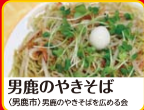
男鹿のやきそば (男鹿市)男鹿のやきそばを広める会