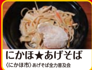
にかほ★あげそば (にかほ市)あげそば全力普及会