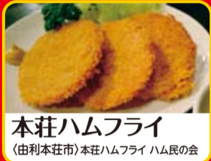
本荘ハムフライ (由利本荘市)本荘ハムフライ ハム民の会

秋田かやき四天王'11 漁師が鍋の代わりに貝を使って料理。貝焼きが訛った言葉が「かやき」。郷土の歴史と共に育まれてきたこの「秋田かやき」をさらに進化させ、現代に合わせて創造した「一人鍋」です。新しい「秋田の食」をぜひご賞味ください!