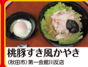
桃豚すき風かやき (秋田市)第一会館川反店