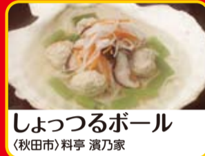
しょつるボール (秋田市)料亭 演乃家